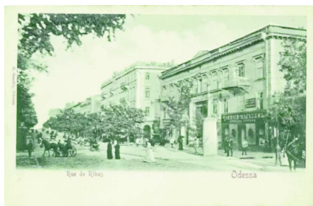
Il viale principale della Città di Odessa dedicato al suo fondatore (Sec.XIX)

Lì dove vi era un piccolo villaggio di pescatori e colline con pochi pastori fu fondata una grande città sul modello delle più belle ed artistiche città italiane.