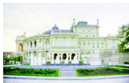
Il Teatro dell'Opera di Odessa

Ma se arrivano i missili dell'armata russa di Putin dal cielo, dal mare e da terra, come è stato per Mariupol la città sarà rasa al suolo ed i suoi abitanti morti, feriti, evacuati, profughi.